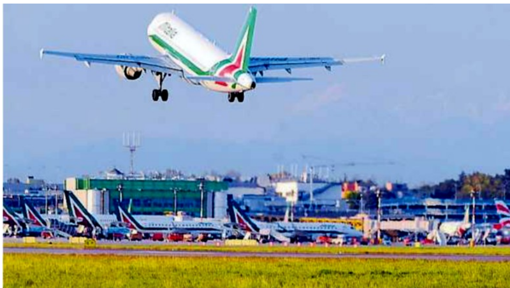
L'aeroporto di Linate

Lo scalo cittadino bloccato per tre mesi, 1.657 voli a settimana spostati, c'è il piano del maxitrasloco